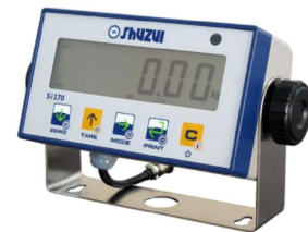
守随本店 SHUJI SCALES CO., LTD. 画像は、標準表示器のイメージです。