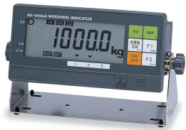
画像は、検定付表示器のイメージです。