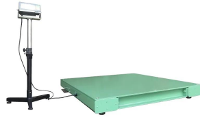
※表示スタンドはオプションです。