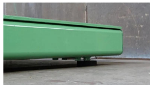
ロードフット部分