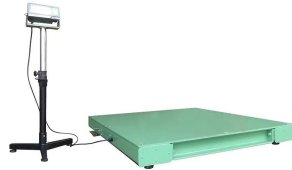
※表示スタンドはオプションです。