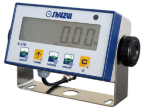
画像は、標準表示器のイメージです。