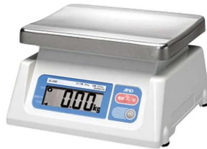
ステンレス皿を別売でご用意