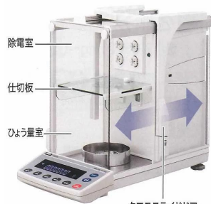
操作性の良いひょう量室