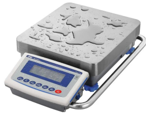
画像は、水濡れ環境のイメージです。