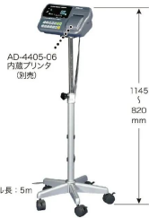
株式会社エー・アンド・デイ