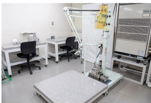
株式会社エー・アンド・デイ