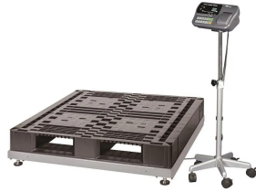
株式会社エー・アンド・デイ