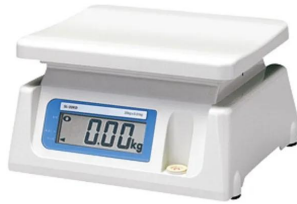
両面表示-Dシリーズの裏面