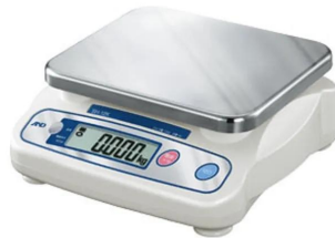
ステンレス皿を別売でご用意