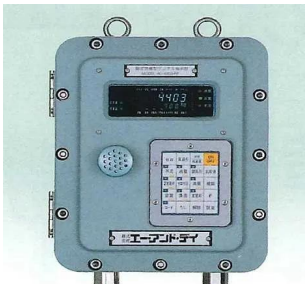
写真は、表示部のイメージです。