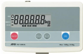
写真は、表示部のイメージです。