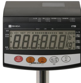
画像は、表示部のイメージです。