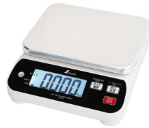
シンワ測定株式会社 画像は、商品イメージです。