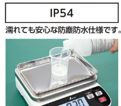
※画像は「70041」です。 シンワ測定株式会社 画像は、使用イメージです。