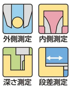
外側測定 内側測定