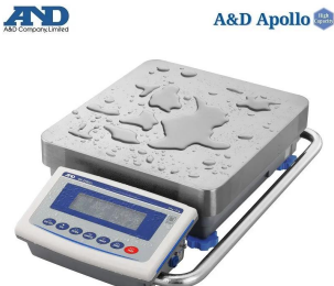
画像は、水濡れ環境のイメージです。