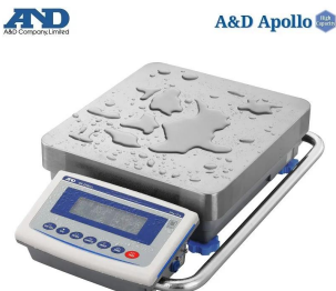
画像は、水濡れ環境のイメージです。