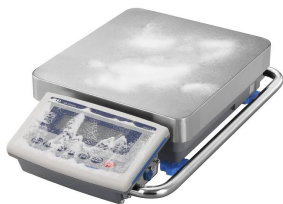
画像は、粉塵環境のイメージです。